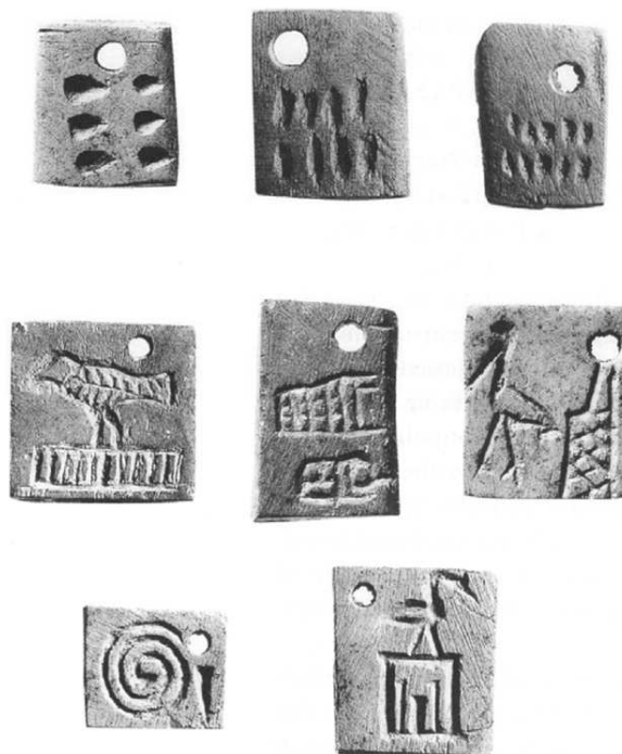
Slika 3. Pločice s najstarijim hijeroglifima (etikete), U-j grobnica, Abid, oko 3150. god. pr. Kr. (grobnica kralja Škorpiona ?, Bard 2002: 64)