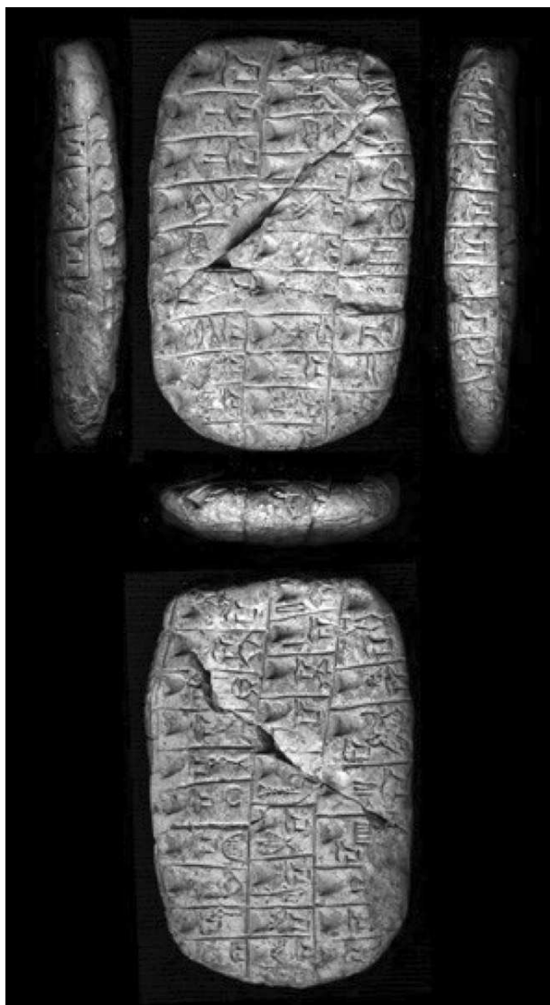
Slika 5. Leksička lista (Lista svinja), Uruk, razdoblje Uruk III (CDLI)