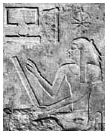
Slika 9. Božica Sešat (CDLI)