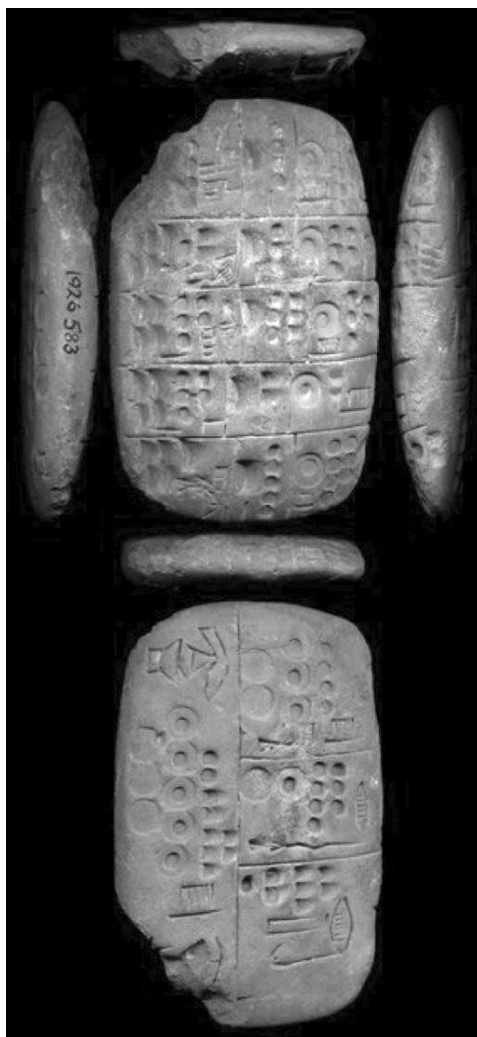
Sl. 1. Protoklinasta administrativna pločica, Djemdet Nasr, razdoblje Uruk III (CDLI) Fig. 1 Proto-cuneiform administrative tablet, Jemdet Nasr, Uruk III Period MSVO 1, 2 (CDLI)

Najranije pravo pismo u Mezopotamiji nastalo je otprilike istodobno kad i u Egiptu, oko 3100. go- dine pr. Kr. (razdoblje kasnoga Uruka, Sl. 1). Među- tim, u Mezopotamiji možemo pratiti njegov razvoj od prvih pomoćnih sredstava brojenja 10 (razdoblje Ubaid, 5500. – 4000. pr. Kr.) preko protoklinastoga (razdoblje kasnoga Uruka) i klinastoga pisma (od ranodinastičkoga II/III razdoblja) sve do njegova