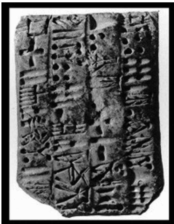
Slika 2. Pločica s protoelamskim pismom, Suza MDP 6, 213 (CDLI)