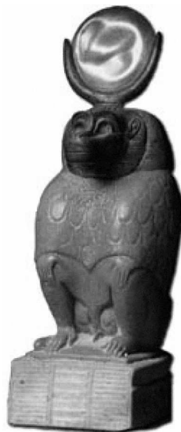
Slika 8. Bog Tot (Egyptianmyths 2009)

Tot je sudjelovao u nastanku vrhovne devetke bogova, pa je dobio i ključnu ulogu ne samo u stvaranju kalendara nego i pri uspostavi nebeskog poretka, a preko toga i zemaljskog. 26 Ta se njegova uloga odrazila u mitu o sukobu Hora i Seta. 27