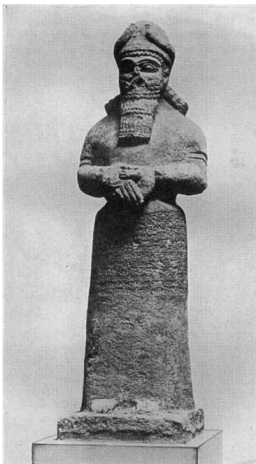
Slika 7. Bog Nabu (Britishmuseum 2009)