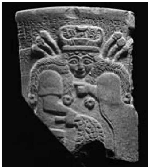
Slika 6. Božica Nisaba (Goddessaday 2009) Fig. 6 Goddess Nissaba (Goddessaday 2009)

U počecima mezopotamske povijesti, u sumerskoj kulturi, pismo i pisare štitilo je žensko božanstvo. Božica Nisaba 18 bila je gospodarica grada Uruka (biblijski Ereh) i u početku božica žita (Sl. 6). Zatim, nedugo nakon nastanka pisma, postala je sumerskom božicom umjetnosti, pismenosti i znanja, i kćeri nebeskoga boga Ana ili Enlila, iako je i tada zadržala attribute koji su je vezali uz poljoprivredu i plodnost zemlje. Njezinim se imenom ponekad u tekstovima čak označava samo žito. Nisaba je “otvarala čovjekove uši”, to jest obdarila je ljude shvaćanjem. U kasnijemu, babilonskom razdoblju Nisaba je postala ženom boga Nabua koji je preuzeo njezine attribute (Green, Black 2000: 206; Michalovski 2001: 575). Bila je važan član panteona; bez nje se ne bi mogli voditi nikakvi računi, ne bi se moglo žeti žito te bi se srušio civilizirani poredak svijeta ( Himna Nisabi ; Black i dr. 2006: 293–294). U sumerskoj poemi stoji da su veliki bogovi uspostavili red na zemlji i zatim podijelili nadležnosti drugim božanstvima. Nisabu su tada proglasili “Pisarom zemlje” (Black et al. 2004: 222, 224). Nisaba je također promatrala i tumačila zvijezde i prema njihovu položaju određivala gradnju raznih zgrada. Brinula se i za stado boga mjeseca Nane (Nanar) i bilježila broj stoke na svoje pločice. 19 Unijela je red u svijet ljudi i odredila granice pokrajina. 20